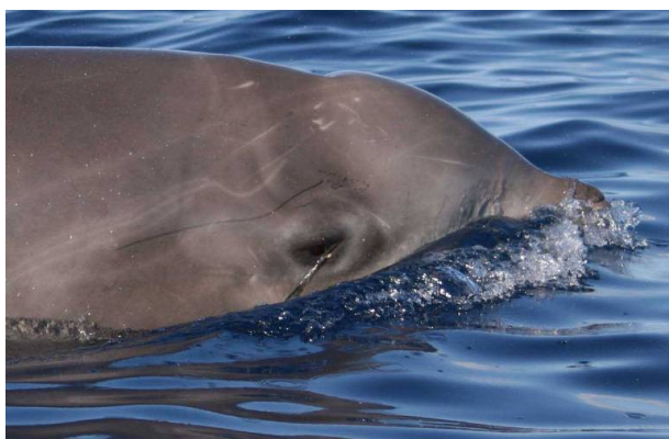
Figura 3: Señal de la interacción con la pesca: un anzuelo de palangre en la región ocular externa de un zifio de Cuvier lejos de las costas de El Hierro, en las Islas Canarias. Foto: Universidad de La Laguna, con el permiso del Gobierno de las Islas Canarias).

La captura incidental de zifios de Cuvier se ha documentado en diferentes zonas geográficas de pesca y, desde el Mediterráneo al Pacífico, afectando principalmente a los zifios de Cuvier, pero también a especies del género Mesoplodon y a zifios de Cuvier no identificados (di Natale 1994; Carretta et al. 2008.). Se notificaron capturas involuntarias de 14 zifios de Cuvier entre 1972 y 1982 (11 en aguas francesas y 3 en aguas españolas), todos ellos abatidos y 1 incluso arponeado (Northridge 1984).